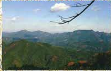
山頂からは、木々の間から北設楽部の山々を見渡すことができます。