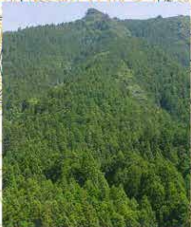
鳴沢苑から見上げると角のように飛び出た小竜頭が見えます。