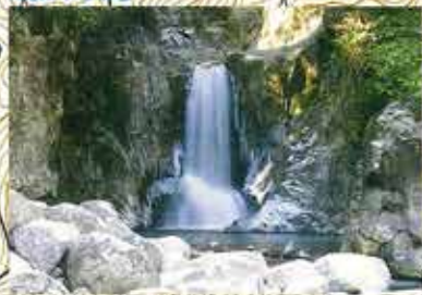
村の天然記念物。村の北端にある落差15メートル、水量も豊富な境界随一の名瀑。