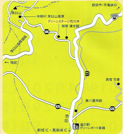
グリーンステージ花の木周辺MAP