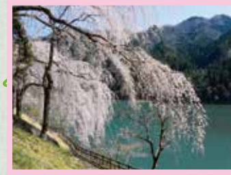
みどり湖 見頃 3月下旬～4月上旬