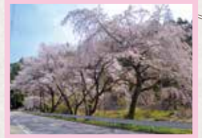
三沢地区 見頃 4月上旬～中旬