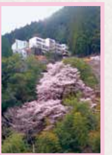
富山地区 見頃 3月中旬～下旬