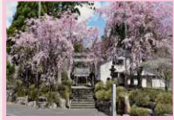
道の駅 豊根グリーンポート宮嶋 見頃 4月上旬～中旬