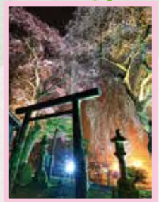
熊野神社 見頃 3月下旬～4月上旬