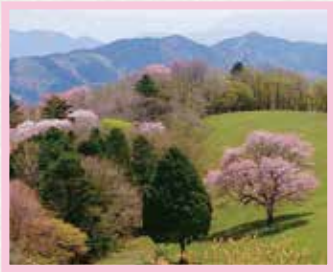
茶臼山高原 一本桜 見頃 5月GW前後1週間頃