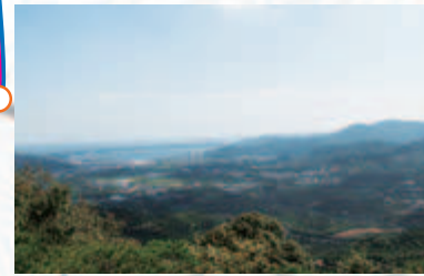
浜名湖方面の眺望

宇利峠からの浜名湖の眺めです。浜名湖や、三ヶ日のミカン畑、北に天下を分けた長篠の合戦の舞台になった設楽原とワイドな眺望を望めます。春はミカン畑に白い花が咲き、秋にはオレンジ色に染まります。