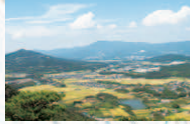
奥三河方面の眺望

雨生山は愛知・静岡県境に連なる弓張山系の南部に位置する山です。東名高速道路を東に向かい、豊川ICを過ぎた辺りから前方に見えてきます。