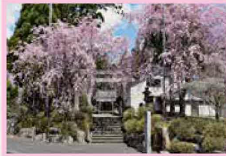
道の駅 豊根グリーンポート宮嶋 見頃 4月上旬～中旬