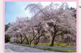
三沢地区 見頃 4月上旬～中旬