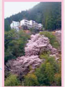
富山地区 見頃 3月中旬～下旬