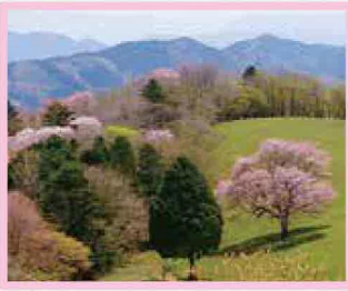
茶臼山高原 一本桜 見頃 5月GW前後1週間頃