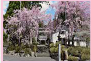
道の駅 豊根グリーンポート宮嶋 見頃 4月上旬～中旬