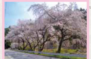
三沢地区 見頃 4月上旬～中旬