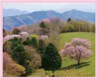
茶臼山高原 一本桜 見頃 5月GW前後1週間頃