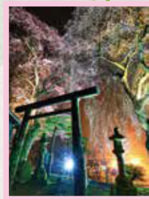
熊野神社 見頃 3月下旬～4月上旬