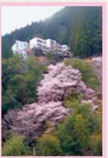
富山地区 見頃 3月中旬～下旬