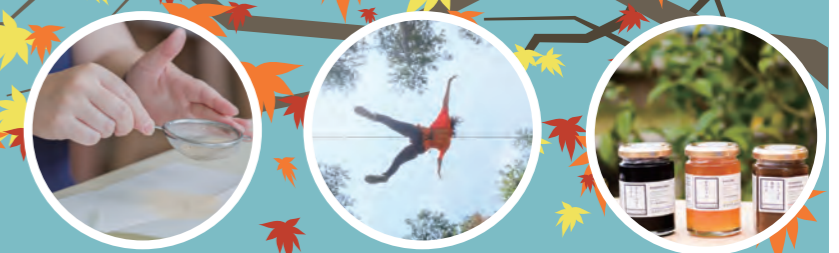
naori® ミネラルファンデーション作り体験 ご招待 フォレストアドベンチャー新城 ご招待 okumikawAwakeブランド等の地元特産品

賞品の内容は予告なく変更することがあります。 なお、賞品画像はイメージです。 新型コロナウイルス感染症の感染状況によっては、本事業を打ち切ることがあります。 お出かけの際は、新城設楽振興事務所及び各ラリーポイントのウェブサイト等でご確認ください。